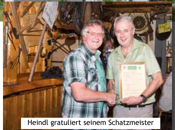
Heindl gratuliert seinem Schatzmeister