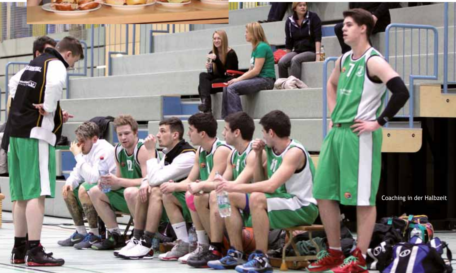
Coaching in der Halbzeit