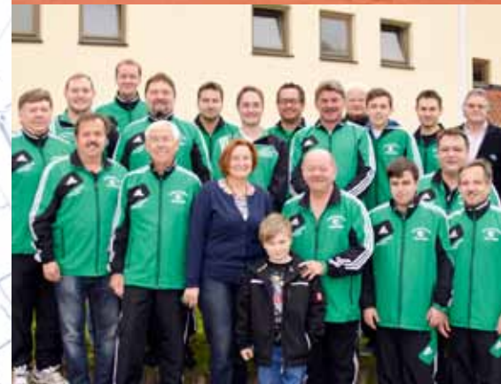
umringt von Tennisfreunden