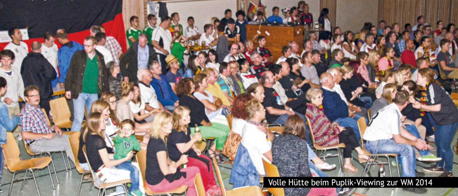
Volle Hütte beim Puplic-Viewing zur WM 2014