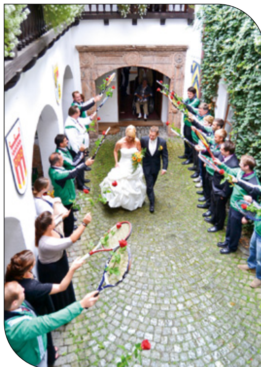
Vorstand Heindl überbringt die Glückwünsche der Spielvereinigung