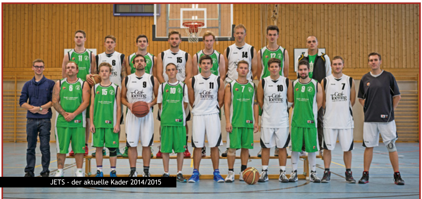
JETS - der aktuelle Kader 2014/2015

Als zehnte Mannschaft war der TSV 1880 Wasserburg 2 vorgesehen. Der Verein hat jedoch unmittelbar vor Saisonbeginn sein Team zurückgezogen.