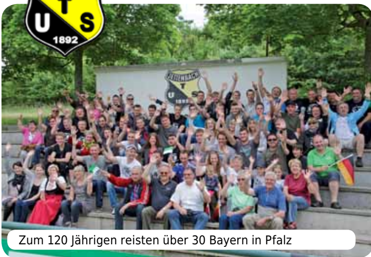
Zum 120 Jährigen reisten über 30 Bayern in Pfalz