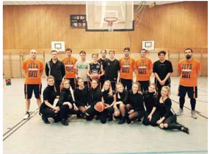
Die Spirit Fingers, eine Hip-Hop Tanzgruppe des TuS Töging begeisterten mit ihrem Auftritt in der Halbzeitpause des Spieles gegen Neuötting sowohl die Zuschauer auf der Tribüne wie auch sichtbar auf dem Foto zu sehen, die Jets-Akteure.