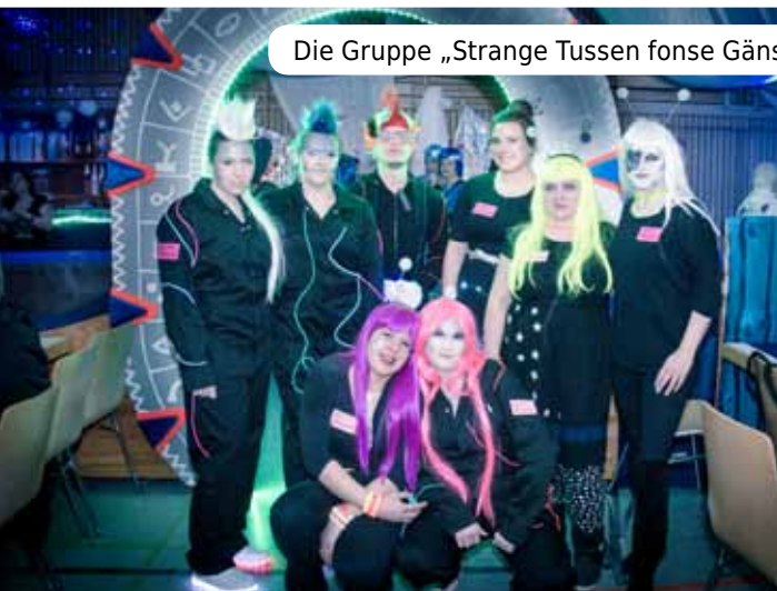
Die Gruppe „Strange Tussen fonse Gänsbuggl Galaxie“ vor dem „Stargate