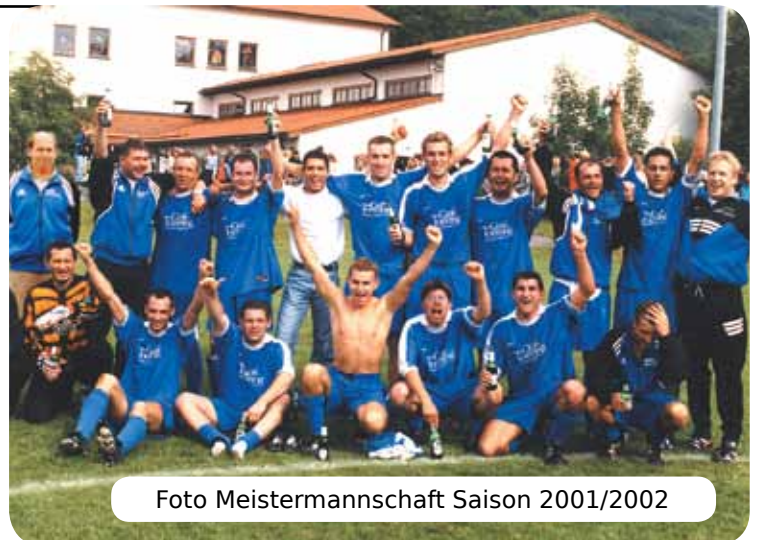
Foto Meistermannschaft Saison 2001/2002