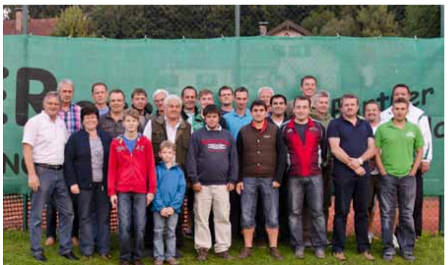
Gut die Hälfte der Helferinnen und Helfer kamen zur Hebfeier